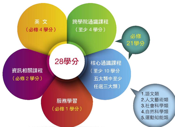
通識教育課程架構